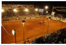
Rodeio Show Agropecuário