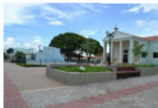
Praça Central de Aracanguá

Prefeitura Municipal (18)3639-9000 Câmara Municipal (18)3639-1221/3639-1214 Departamento de Meio Ambiente e Turismo (18) 3639-1320 Casa Lotérica (18)3639-1422 Cartório de Registro Civil (18)3639-1117 Correios de Aracanguá (18)3639-1223 Correios de Major Prado (18)3639-8329 Correios de Vicentinópolis (18)3604-1304 Delegacia Civil (18)3639-1222 Delegacia Militar (18)3639-1213 ou 190 Unidade Básica de Saúde de Major Prado (18)3639-8301 Unidade Básica de Saúde de Vicentinópolis (18)3604-1247 UBS e Pronto Atendimento 24h de Aracanguá (18) 3639-9595 ou 192