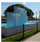
Fonte Praça Central - Aracanguá