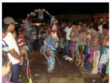
Festa de Santos Reis